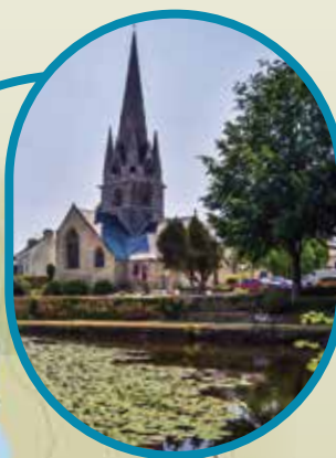
ROSPORDEN LES ÉTANGS L'ÉGLISE NOTRE-DAME DE ROSPORDEN