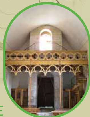
CHAPELLE BONNE NOUVELLE MELGVEN